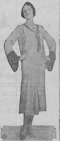
Traje de crepé color oro, adornado con crepé negro. La blusa lleva mangas en forma de campana. Un turbante de terciopelo negro y zapatos negros de cuero completan la tenida