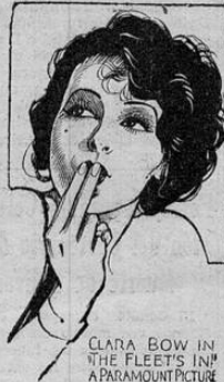
CLARA BOW IN "THE FLEET'S IN!" A PARAMOUNT PICTURE

La batalla del Moderno refleja esta noche en su única función a las 7 p. m. la espléndida película Paramount titulada LLEGO LA ESCUADRA una deliciosa comedia por la insigne y imitable Clara Bow.